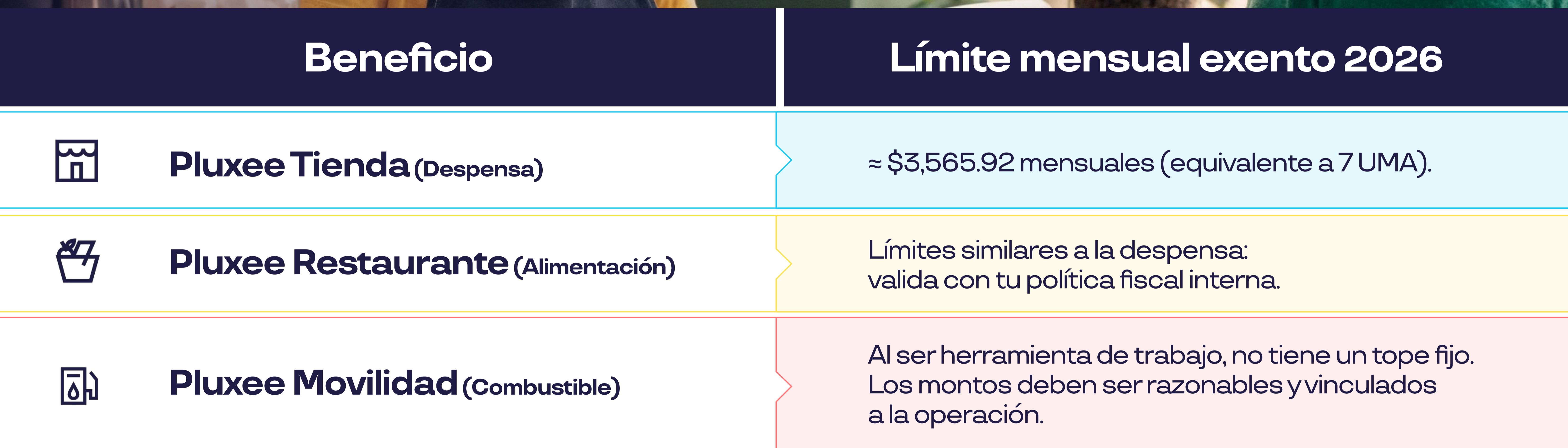
Tabla de exenciones 2026